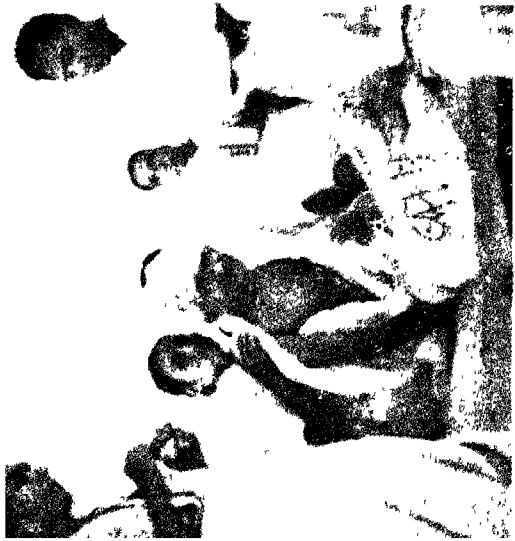
बापू : राजकोट में उपवास के समय